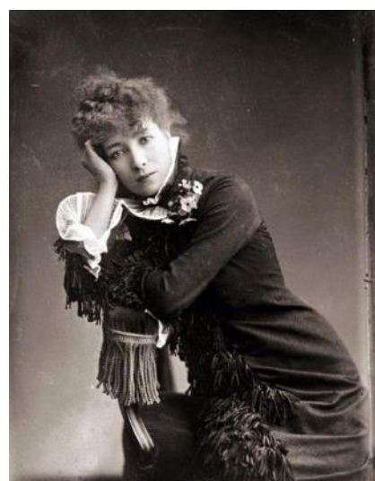
Сара Бернар или Генриетт Розин Бернар