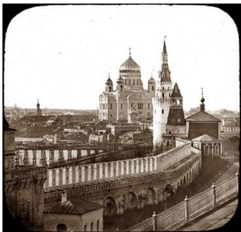
Храм Христа Спасителя

Перед вами фотографии достопримечательностей Москвы, сделанные большей частью в 60-80-е годы XIX века. Какие сооружения изображены на фотографиях?