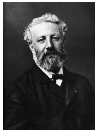
Жюль Верн или Жюль Габриэль Верн