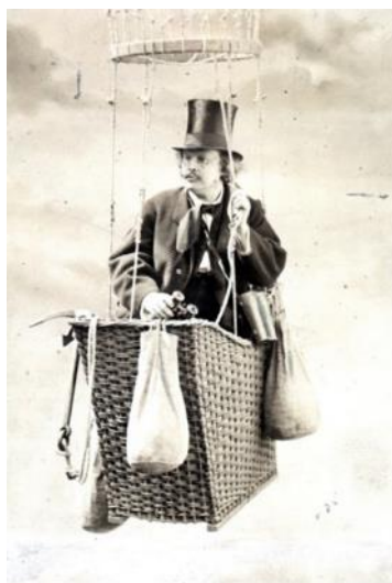
Феликс Надар или Гаспар Феликс Турнашон или Феликс Турнашон