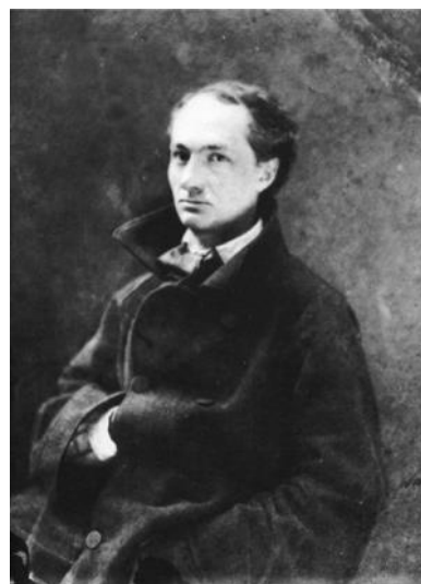
Шарль Бодлер или Шарль Пьер Бодлер