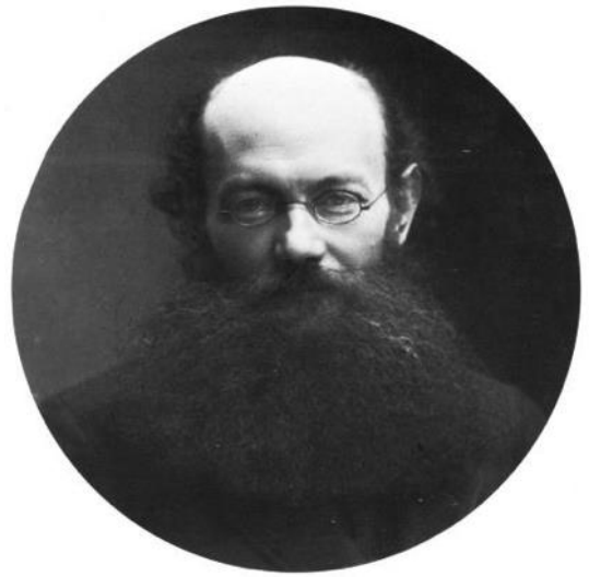
Петр Кропоткин или Петр Алексеевич Кропоткин

Задания 36-41. Вскоре после возвращения из пенсионерской поездки по Европе Репин с семьей обосновался в Москве. Они прожили здесь 5 лет, с сентября 1877 по сентябрь 1882 года.