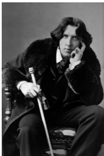
Оскар Уайльд или Оскар Фингал о`Флаэрти Уиллс Уайльд