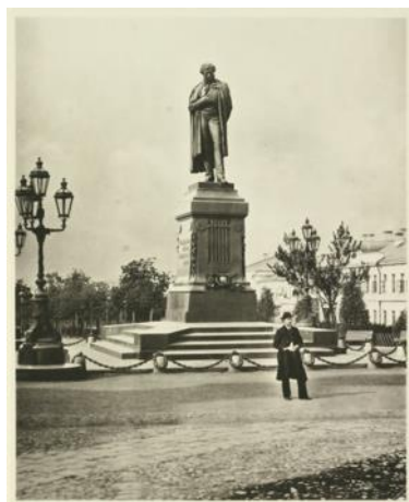
Ничего из вышеперечисленного