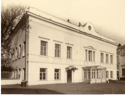
Дом П. М. Третьякова