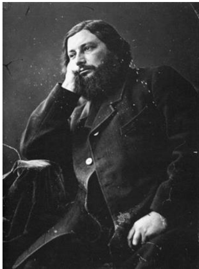
Густав Курбе или Жан Дезире Густав Курбе