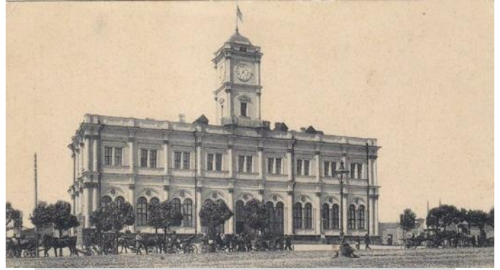
Николаевский железнодорожный вокзал

Задание 42. Какое из этих сооружений (см. на картинки заданий 36-41) построено в «русском стиле»?